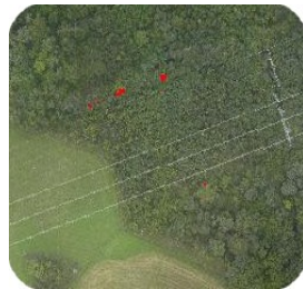
Laserdata og ortofoto for identifikasjon av farlige trær