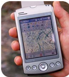
Bruk av håndholdt PC effektiviserer skogryddinga